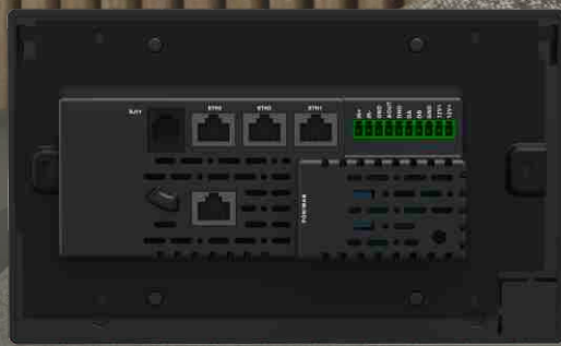
SK-RM22S (网线输入 POE供电)